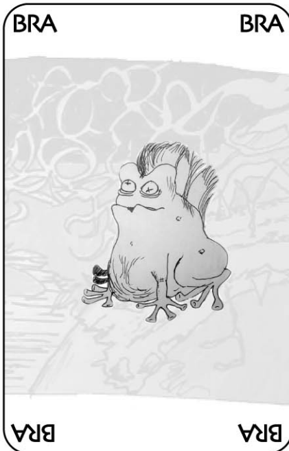
PLANCHE 1 : IMPRIMER EN 3 EXEMPLAIRES